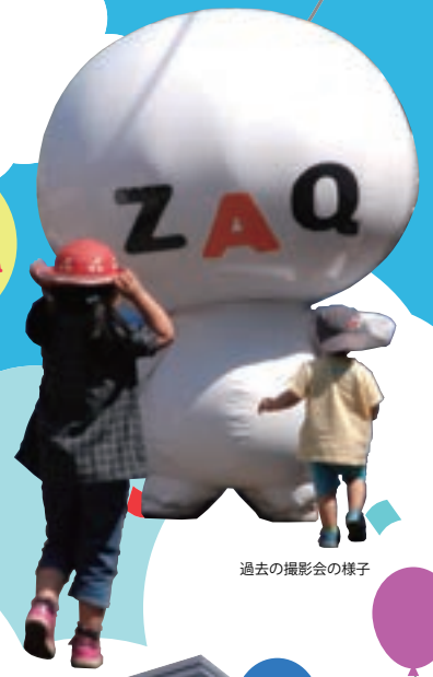
過去の撮影会の様子