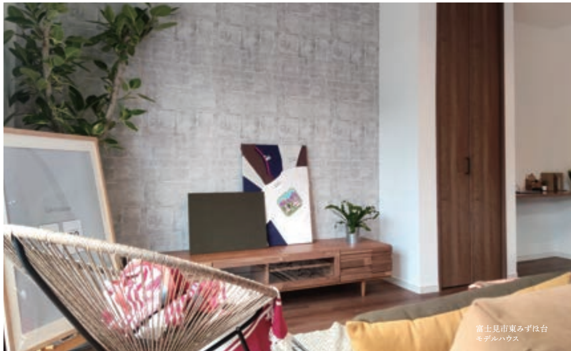
富士見市東みずほ台 モデルハウス